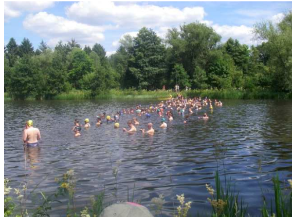
Start beim Schwimmen